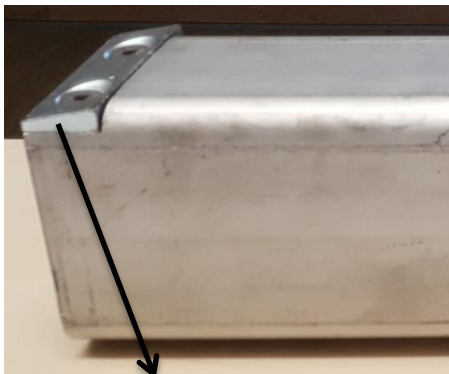
Rungekeil für spielfreien Sitz

Beim Betätigen des Verschlusses darf nur ein Imbusschlüssel mit kurzem Hebelarm verwendet werden (Imbuss 14mm). Durch einen innenliegenden Exzenter mit Umlenkung wird ein Verschlussbolzen aus der Runge geschoben. Da dieser Bolzen Federbelastet ist wird fast keine Muskelkraft benötigt