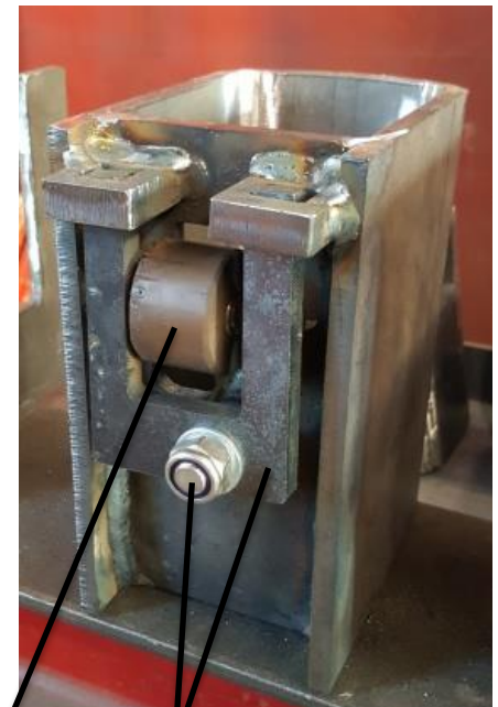
Verstellbügel mit Einstellschraube Andruckrolle

WICHTIG! Es ist zu überprüfen dass die Runge verriegelt ist!