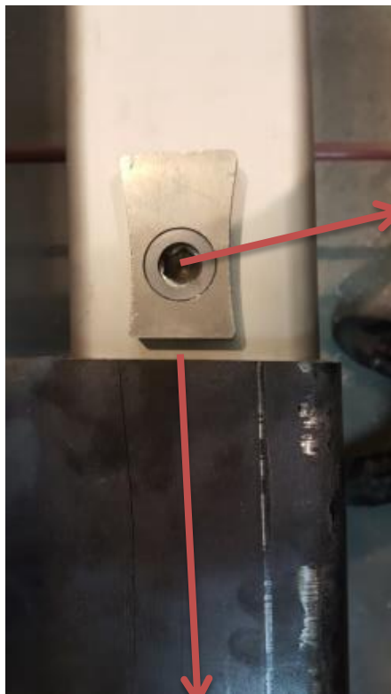
Abstand Führung Oberkante Tasche (5-7mm)

Nach dem Einstecken der Runge in die Tasche, ist darauf zu achten das der Abstand zwischen der aufgeschweißten Führung und der Oberkante Tasche maximal 5-7mm beträgt.